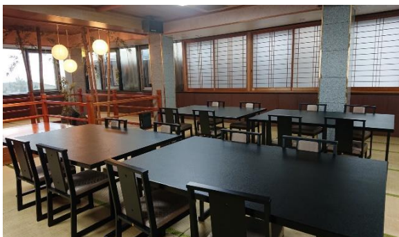
ワークショップ会場