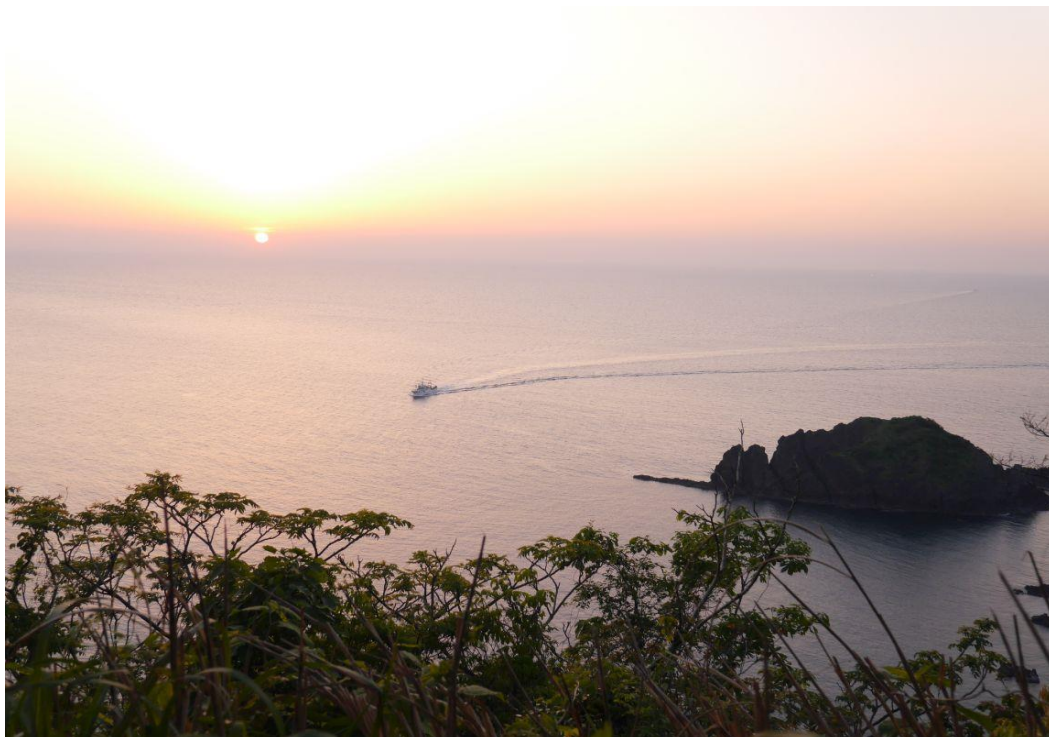
日本遺産北前船寄港地「諸寄港」城山園地からの夕日