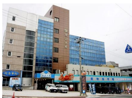
マル海渡辺水産 外観